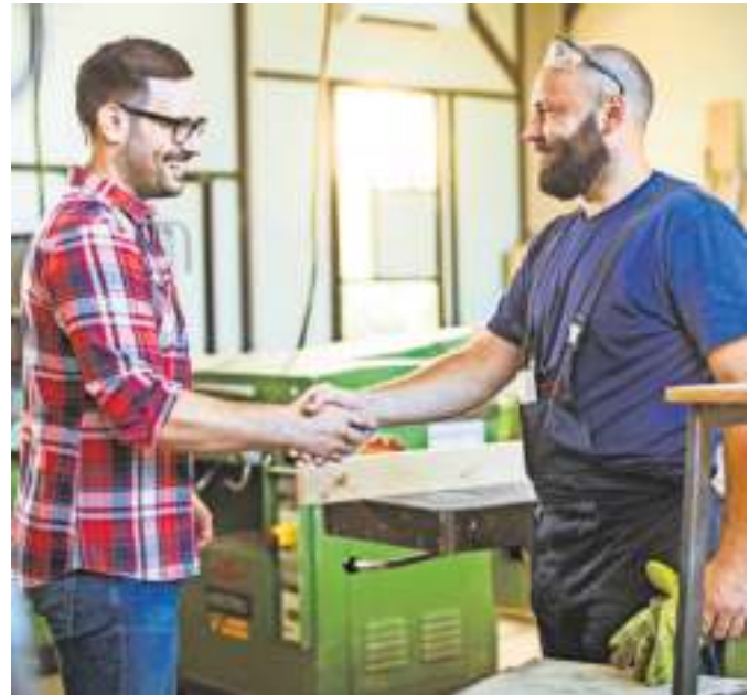
Wer einen guten Handwerker gefunden hat, kann sich freuen. Oft entsteht dann eine langfristige Kundenbeziehung.

Ob man nun eine Wärmepumpe eingebaut, eine Waschmaschine repariert, einen Baum gefällt oder einen Herd angeschlossen haben möchte: Einen gu-