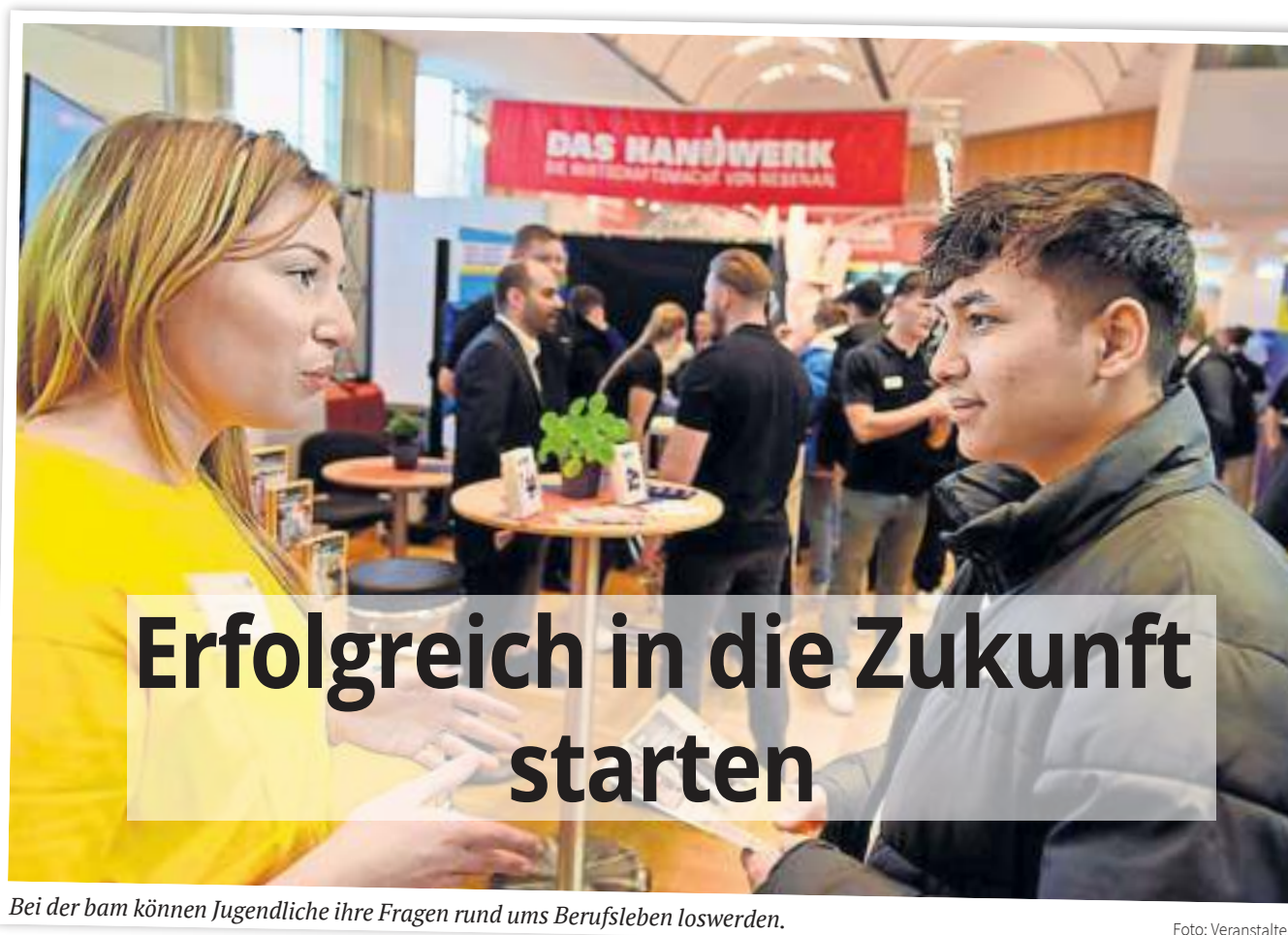
Bei der bam können Jugendliche ihre Fragen rund ums Berufsleben loswerden.