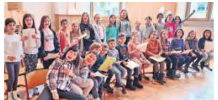
Während der Chorproben herrscht große Freude bei den Kindern.