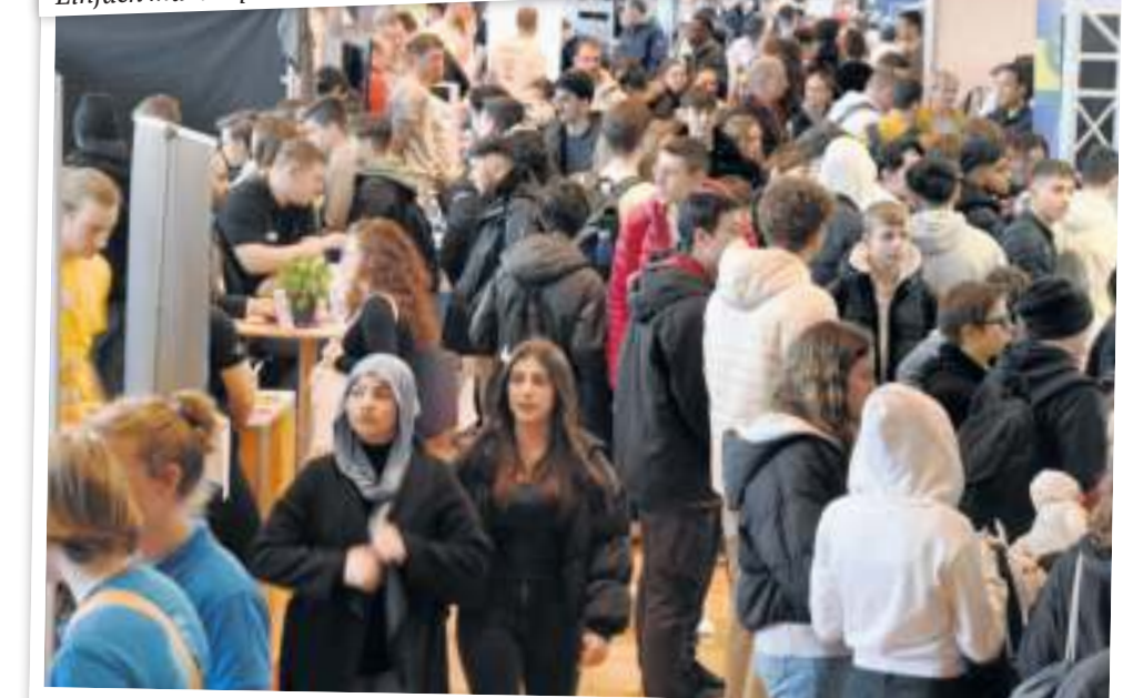
Die bam ist eine Anlaufstelle für Jugendliche im Landkreis.