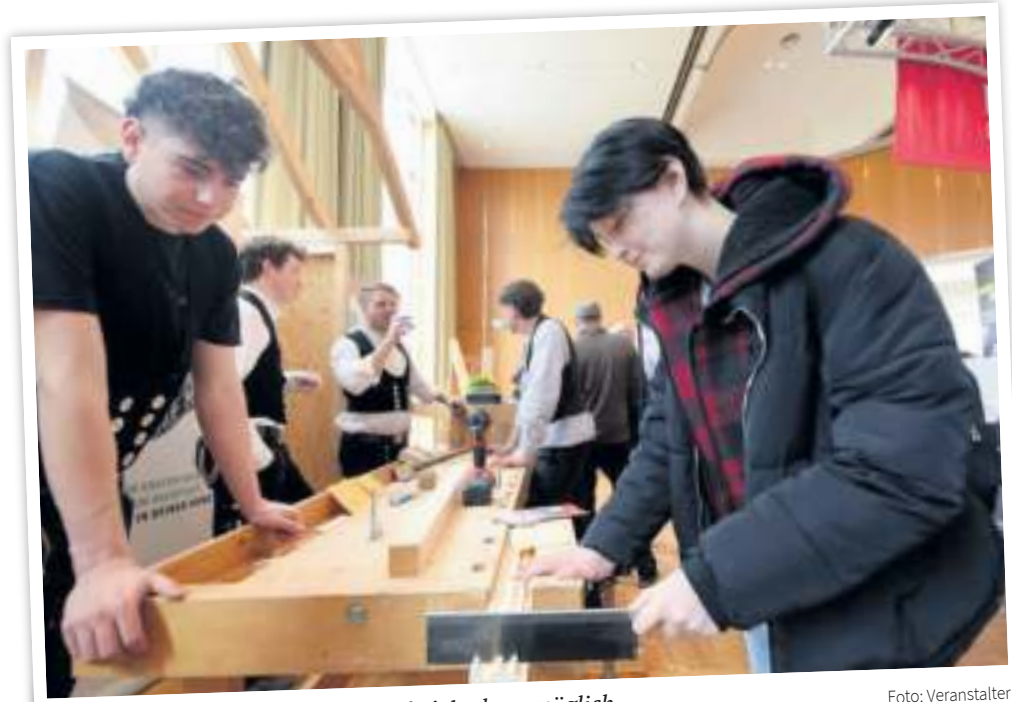
Einfach mal ausprobieren: Das ist bei der bam möglich.