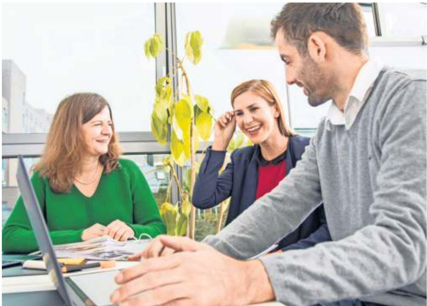
Je offener und neugieriger ein junger Mensch ist, desto leichter fällt ihm oder ihr der Einstieg in den neuen Kollegenkreis.

Azubis brauchen vor dem ersten Arbeitstag ein eigenes Bankkonto und sollten sich mit ausreichend zeitlichem Vorlauf um eine Steueridenti-