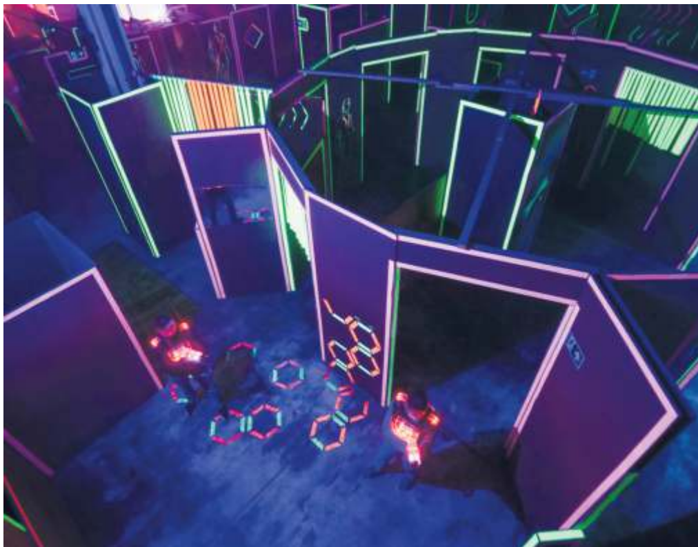
Anschleichen, ohne dass es der andere bemerkt, ist oft gar nicht so einfach.

Standardmäßig treten zwei Teams gegeneinander an. Das Team mit den meisten Punkten gewinnt. Seinen Teamkameraden erkennt man an der Farbe seiner leuchtenden Weste. Gespielt werden kann aber auch als Einzelperson im Modus „Jeder gegen jeden“, sodass am Ende die Person als Sieger feststeht, die die meisten Punkte gesammelt hat. In der Lasertag Arena in Kornwestheim findet man demnach immer Mitspieler und benötigt keine Gruppe. Ins-