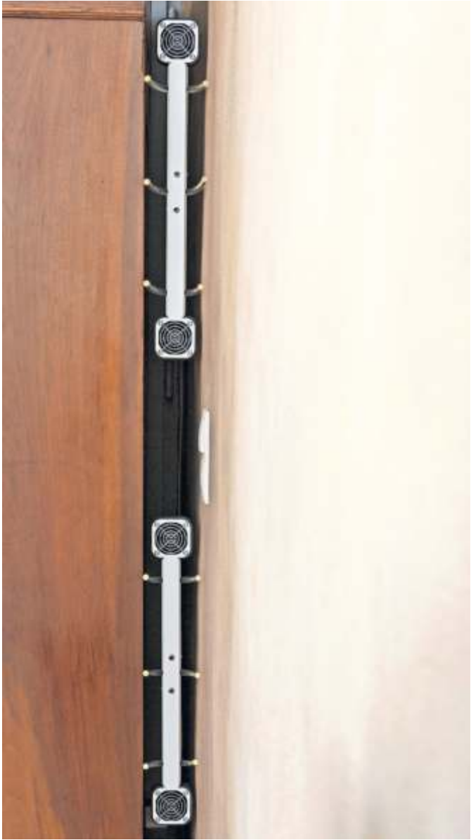
Hinter Schrankwänden bildet sich schnell mal Feuchtigkeit. Lüftungsgeräte sorgen hier für Abhilfe.

Mobil und flexibel einsetzbar Für größere Raumecken oder unter Schrägen, in denen häufig die Luft steht, eignen sich Anti-Schimmel-Standlüfter. Sie arbeiten nach demselben Prinzip und sorgen durch die regelmäßige, leise Luftverwirbelung für gesunde Verhältnisse, ganz ohne Chemie. Da die Geräte für gewöhnlich kompakt und leicht sind und lediglich eine Steckdose benötigen, stellen sie auch die passende Lösung für Mietwohnungen dar. Bei einem späteren Umzug kommen sie einfach mit. djd Eines sollten Betroffene allerdings beachten: Wenn sich bereits Schimmel in der Wohnung ausgebreitet hat, ist es unverzichtbar, zunächst den Befall fachgerecht entfernen zu lassen, bevor man als zukünftige Vorbeugung die Lüftungsgeräte verwendet.