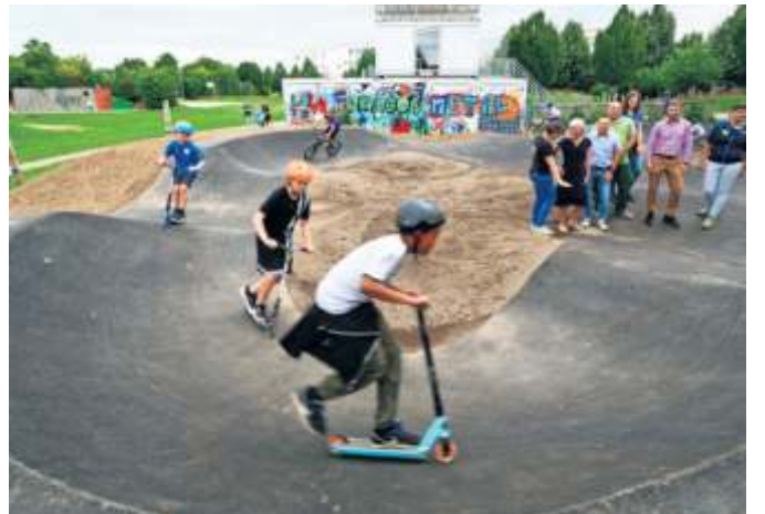
Wer den Bogen raus hat, kann eine Runde nach der anderen drehen.