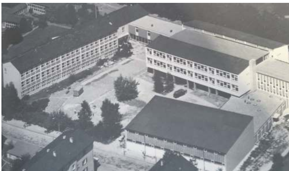
Das Ernst-Sigle-Gymnasium wurde im Laufe der Jahre mehrfach erweitert.

Zunächst waren die Schüler in Pavillons auf dem heutigen Gelände der Philipp-Matthäus-Hahn-Gemeinschaftsschule untergebracht. Im Oktober 1953 konnte schließlich der Südbau eingeweiht werden. Das Gebäude der heutigen Aula des ESG wurde erst im Oktober 1961 in Betrieb genommen. Zu diesem Zeitpunkt erhielt die Schule auch ihren Namen Ernst-Sigle-Gymnasium. Ein Jahr später wurde dort erstmals das Abitur abge-