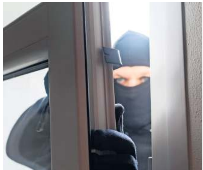
Urlaubszeit ist Einbruchszeit.