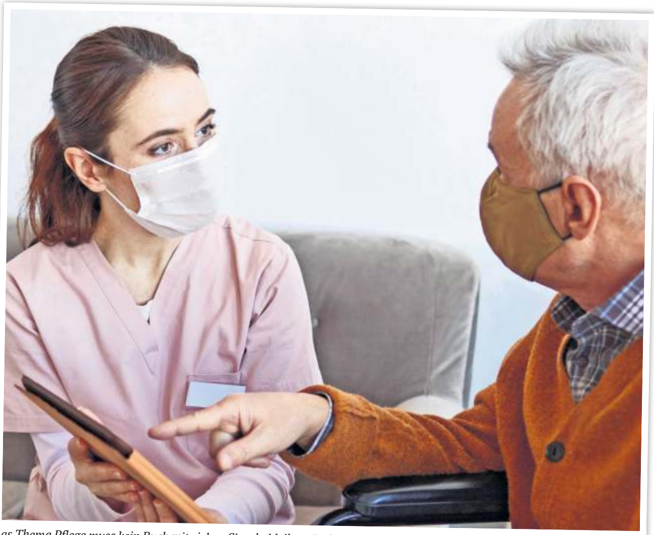
as Thema Pflege muss kein Buch mit sieben Siegeln bleiben. Dafür sorgen auch Hilfsdienste.