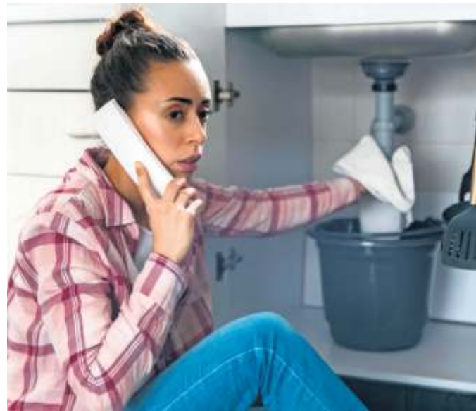
Wer dringend einen Handwerker braucht, sucht passende Anbieter in der Nähe oft über ein Branchenverzeichnis.