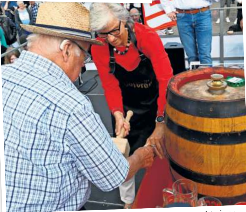
Das Fass sticht auch in diesem Jahr wieder die Oberbürgermeisterin an.