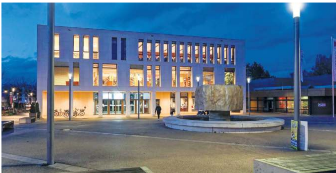
Der Neubau hat die Stadt Kornwestheim rund 24,5 Millionen Euro gekostet.