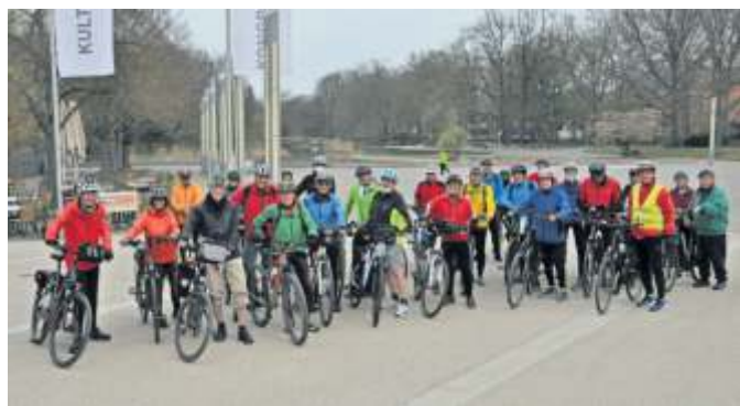
Der Radtreff startet wieder durch.

Auch wenn sie mehrfach umgebaut und saniert wurde, dem Keller eine Mensa verpasst und die Turnhalle generalüberholt wurde: In ihren Grundzügen ist die Silcherschule die Alte geblieben.