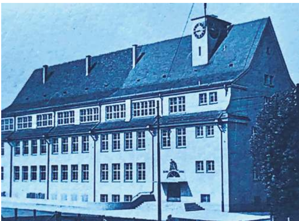
Die Schule in den 1920ern: Vor dem Brand hatte sie noch einen Uhrenturm.

Die Froschkönig-Brunnenfigur des Bildhauers Karl Eisele gibt es immer noch. Auch die Betonwerksteine auf dem Boden oder die Trennwände aus Holz und Glas in den hohen Gängen haben die Zeiten überdauert. Der charakteristische Uhrenturm hingegen wurde, wie das ganze Dachgeschoss, bei einem von einem Brandstifter gelegten Feuer zerstört. Das einstige Schülerbad im Untergeschoss, der Kohlenkeller, die mustergültige Schulküche: alles längst Geschichte.