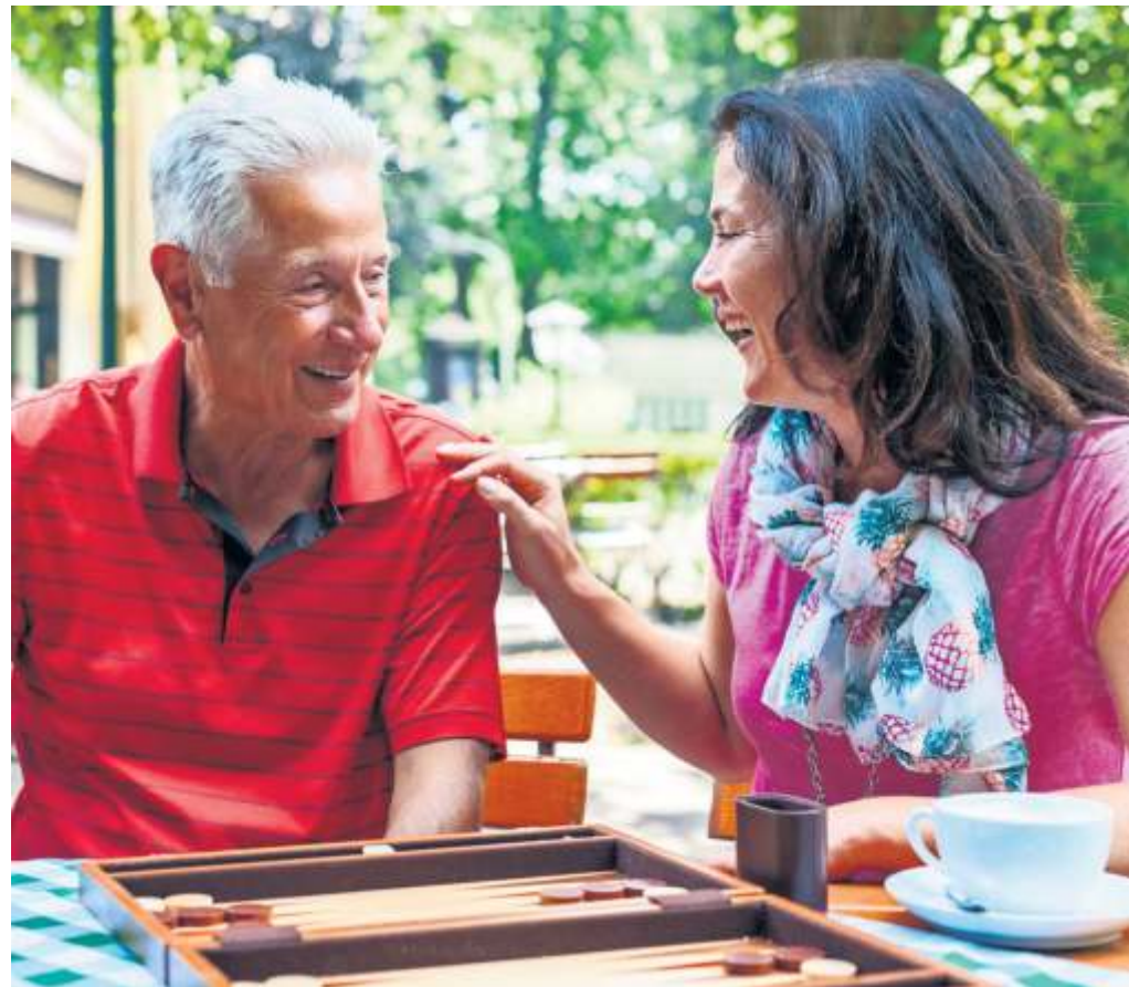
Bei einer professionellen Seniorenbetreuung erhalten ältere Menschen Anerkennung, Wertschätzung und soziale Teilhabe am gesellschaftlichen Leben. Die Senioren-Assistenten selbst wiederum finden Sinn und Befriedigung in dieser Aufgabe.